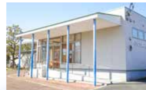
↑ 院外処方に変更した方城診療所は、その運営を現在コスモス診療所の院外薬局を開設する(株)マーキュリーに委託。4月から数地内の院外薬局で処方を開始します。

これまで福智町は、地域医療を守るべく、コスモス診療所と方城診療所の運営を継続しながら人件費や維持経費の削減など経営改善を図ってきました。しかしながら、これまでに一般会計からの助成金や赤字補填額が両診療所で約15億を超えており、今後の町財政をさらに圧迫することが予測されます。そのため、コスモス診療所を利用者の多い方城診療所へ統合し、両診療所を一本化することで持続可能な地域医療を確保する苦渋の決断を行いました。 方城診療所は現在、今年4月からの運営に向け、診療室や待合