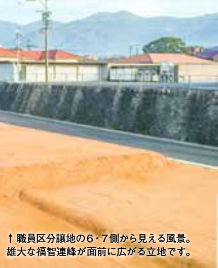
↑職員区分譲地の6・7側から見える風景。雄大な福智連峰が眼前に広がる立地です。

また、土地代金を一括払いできる人、市町村税や各種使用料などに滞納のない人、反社会的勢力の構成員ではなく、反社会的勢力と密接な関係ではない人に限ります。子育て支援の施策に力を込める福智町。ぜひこの機会に職員区分譲地の購入をご検討ください。皆さまのお申し込みをお待ちしています。