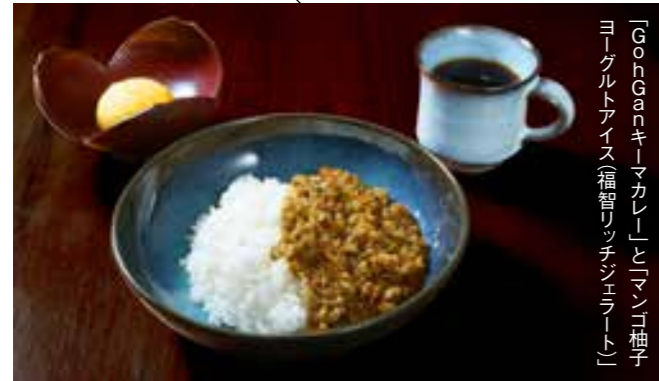
「GohGanキーマカレー」と「マン」柚子 ヨーグルトアイス(福智リッチジェラート)