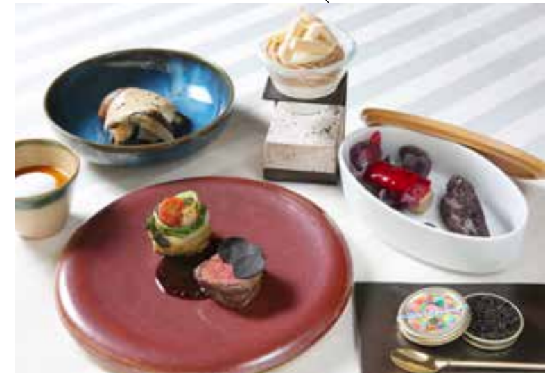
キャビアを敷き詰めたリンゴのムース/福智産あまおうとフォアグラのテリーヌ、カカオパン/豊前本ガニのスープ/蒸アワビと椎茸のソテー、イカ墨リゾット/赤崎牛ヒレ肉のロースト・黒トリュフソース/福智産栗モンブランの6品を予定。