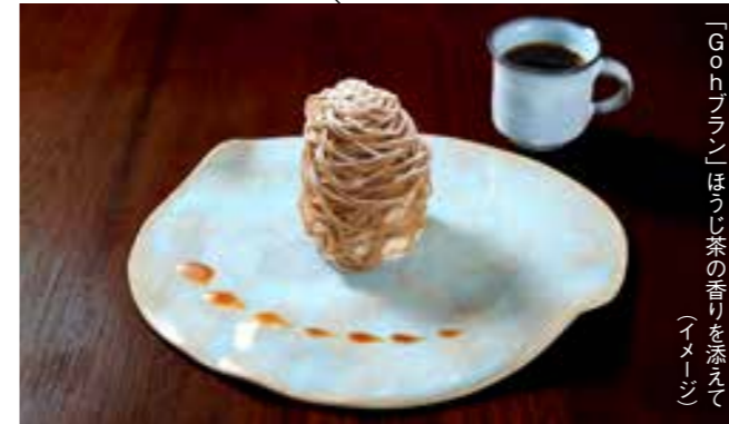
「Goh」モンブラン」ほうじ茶の香りを添えて (イメージ)