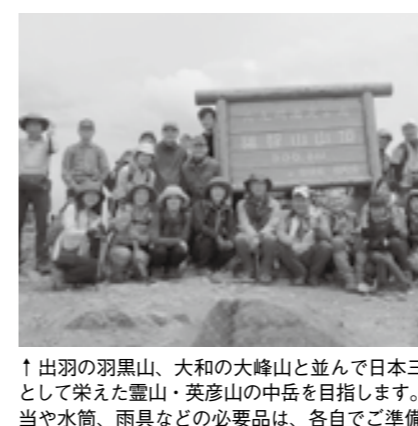
↑出羽の羽黒山、大和の大峰山と並んで日本三大修験道として栄えた霊山・英彦山の中岳を目指します。昼食の弁当や水筒、雨具などの必要品は、各自でご準備ください。

経済産業省による緊急処置の案内 経済産業省より、新型コロナウイルス感染症の影響を受ける中小企業者の資金繰り支援措置として「セーフティネット保証(4号)」及び「危機関連保証」を発動しました。対象企業者は、認定申請書(指定様式)、売上高の減少を証明する書類などを「まちづくり総合政策課」の窓口へ提出し、町の認定を受けなければいけません。認定後は、金融機関や信用保証協会に認定書を持参し、保証付き融資の申し込みが必要です。 ※町の認定は、金融機関・保証協会の融資を確約するものではありません。 窓口 役場まちづくり総合政策課 ☎22-7766