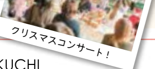
クリスマスコンサート!