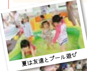
夏は友達とプール遊び