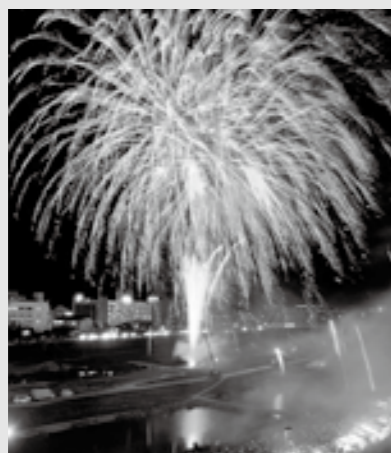
毎年10万人が訪れる飯塚の夏を彩る納涼花火大会。仕掛花火や約5千発の打上花火が夜空に咲き誇ります。