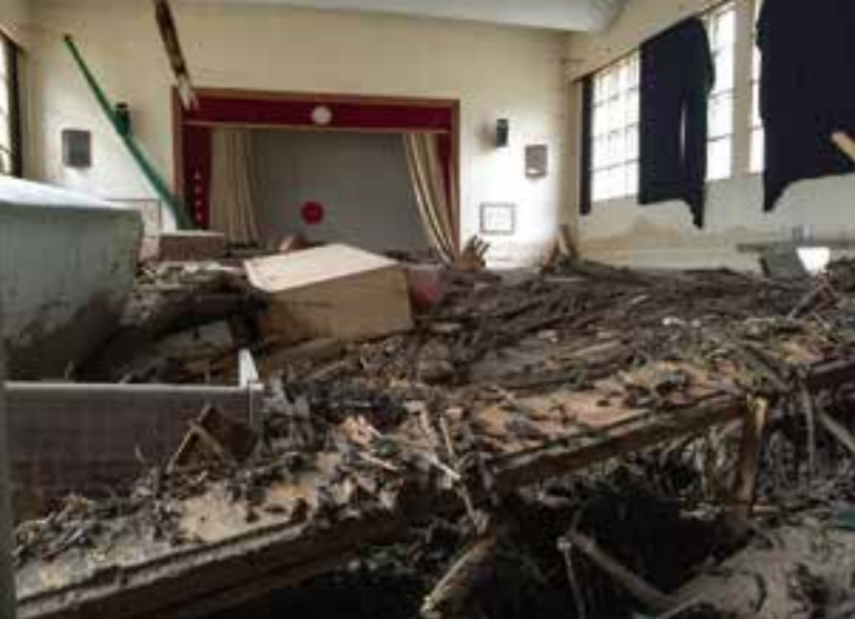
↑土砂と流木が流れ込んだ体育館(上)と校舎(下)。体育館がせき止めなければ、校舎も危険にさらされていた。

「あの時、誰もが被災者でありながらお互いに助け合い、支え合いました。そのことで多くの命が救われたのは間違いありません。孤立した私たちはなすすべも無く、救助を待つしか無かった。助かったのは幸運でした。そうならないためには、手遅れになる前に逃げるしかありません。取材した人や顔見知りも命を落とした。『雨でも人は死ぬ』ということを実感しました」と中川記者は振り返ります。