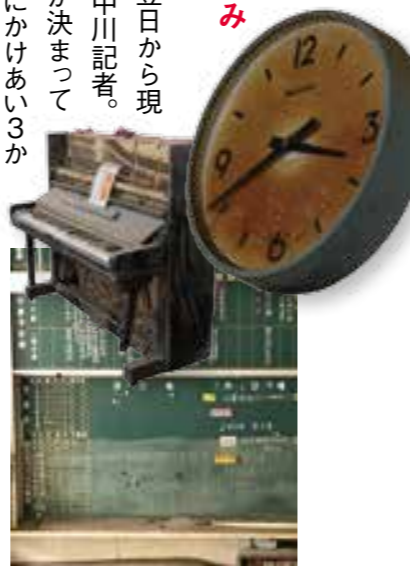
↑被災直後、黒板に残る浸水の跡。現在廃校となった松末小では、多くが当時ままの状態が残っている。

無事に帰宅した翌日から現場へ向かったという中川記者。「実は筑豊への転勤が決まっていたのですが、会社にかけあい3か月残留しました。この災害を伝える義務があると思ったからです」。1週間以上休まずに、深夜まで被災地の実情を発信し続けました。「『いい経験をしたね』と言われたこともありますが、そんな必要は絶対にあります。体験した人とそう