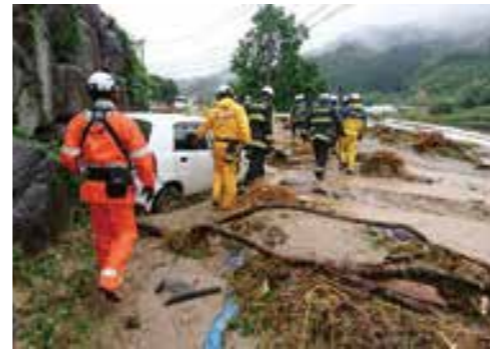
↑朝倉市に派遣された消防職員たち。災害発生時には、全国から応援隊が派遣される。