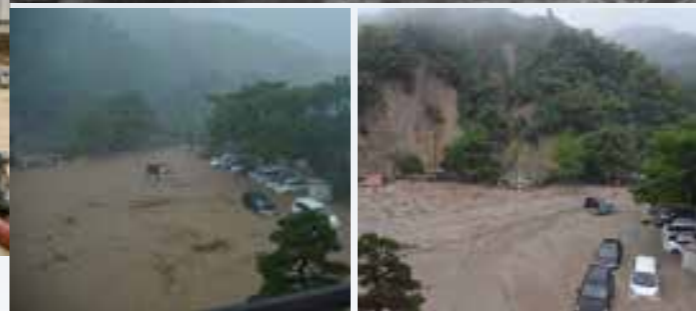
↑5日の豪雨当時の校庭と(左)翌朝の状況(右)。車両が土砂で埋め尽くされ、崩落した崖の様子が確認できる。