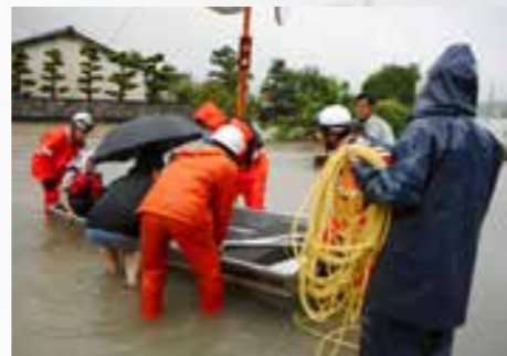
↑昨年の福智町での豪雨時、町民からボートを借りた消防隊が救助を実施。これが共助の際たる例と二場さんは強調する。

重要性を伝えていきます。また常に最悪の事態を想定すること。増水時に田畑や川など見に行くのは絶対にやめてください。いざという時、命を守るのは人とのつながりと早めの避難です。そのことを決して忘れないでください。