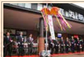
お客様を乗せ運行開始