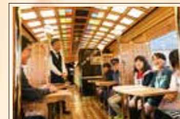
弁城小の児童を招待

7回の試運転を経て、ことごと列車が一般のお客様を乗せて出発。出発前の式典では、出席者らがくす玉開きをして運行開始をお祝い。多くの見物客や報道陣に見送られ、新たな門出を迎えました。