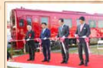
車両のお披露目式

平成30年豪雨災害時に支援金を平成筑豊鉄道に贈呈した弁城小の代表児童をことごと列車にご招待。初めて見る豪華観光列車に「大きくなったら乗ってみたい」と目を輝かせていました。