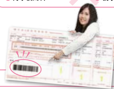
コンビニ納付ができる新しい納付書はバーコードが目印です！

Q. コンビニ納付できない料金はどのようになるの？ 水道使用料など一部の料金はコンビニ納付に対応していません。支払い方法はこれまでと変わりませんので、役場窓口での納付や口座引落をご利用ください。