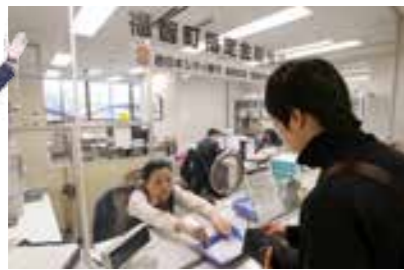
←4月から本庁内の銀行窓口を廃止し、新たな窓口を設置予定。