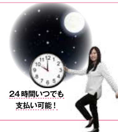
24時間いつでも支払い可能！