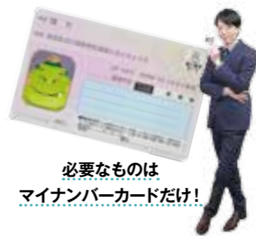
必要なものはマイナンバーカードだけ！

4月からコンビニエンスストアに設置してあるキオスク端末(マルチコピー機)を自分で操作して、福智町の住民票や戸籍、各種税証明などが役場窓口に行かずに取得できるサービスが始まります。端末はタッチパネルの簡単操作で、証明書交付後のデータは一切残らず個人情報も守られて安心。夜間や休日、外出先や勤務先