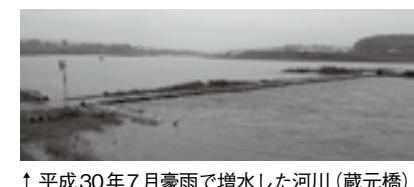
↑平成30年7月豪雨で増水した河川(蔵元橋)

全国各地で頻発 している豪雨災害。 インフラの重要性 や効果を認識する とともに、ソフト 対策による地域防 災力の向上、地域 住民の正しい避難 行動についてシン ポジウムを開催。 (入場無料。遠賀川河川事務所ホ ムページより申し込みください。) 日時 1月24日(日)13時30分～17時 場所 ユニシティのおがた (直方市山辺364-4) 問 国土交通省 遠賀川河川事務所 防災情報課 ☎ 0949-22-1830