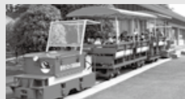
→2日目は開催のトロッコ乗車は人気のアトラクションのひとつ。

10月27日 ㊟・28日 ㊟ (赤村役場内赤村住民センター) 全国で80か所以上あると言われる未成線の路線。初日は全国から集まった未成線団体によるパネルディスカッションが行われます。2日目はトロッコイベントを開催。 岡 赤村役場 政策推進室 ☎ 62-3000