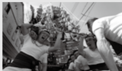
一山笠を担ぐ男衆。高さ9mの山笠が町内を練り歩く。

【糸田町】糸田祇園山笠 5月12日 困 ~ 5月13日 回 (糸田町フェスティバルパーク) 300年以上続く伝統行事。第21回ふるさとイベント大賞では優秀賞を受賞。