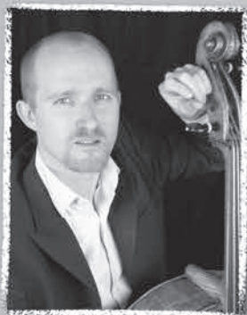
エマニュエル・ジラルール (チェロ)