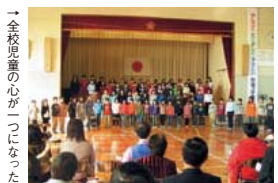
「全校児童の心が一つになった」

12月1日、保護者や地域の人を招いての発表会が、弁城小学校で行われました。中でも学年ごとの詩の朗誦や全校朗読は参加者に感動を与え、堂々と発表している成長した我が子の姿に、思わず涙を流す保護者もいたほどでした。また、以前から交流のある北九州朝鮮初級学校の子どもたちも参加し、詩の朗読や歌を披露。心に残る一日となったようです。