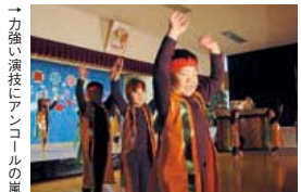
「力強い演技にアンコールの嵐」

そよ風保育園の発表会が12月9日に行われました。4週間前から練習を重ねてきた園児たちの立派な演技を見に、およそ200人の保護者が来園しました。年長のぶどう組にとってはこれが最後の発表会。自分で書いたことわざの発表や、合奏、そして最後は一番力を入れて練習した「よさこいソーランロック」を披露し、たくさん拍手が送られました。