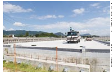
← 車道が広がり、歩道も設置。