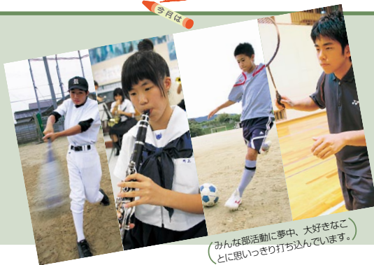
みんな部活動に夢中、大好きなことに思いっきり打ち込んでいます。

福智町の行事である車イステニス大会国際交歓会に、本校の生徒会執行部と吹奏楽部が毎年参加しています。今年は、生徒会執行部が選手の皆さんへの歓迎の言葉や体育会の棒体操を披露し、吹奏楽部は体育会の曲を演奏しました。また、その他多くの生徒も会場を訪れ、選手や地域のかたと一緒にステージ発表を楽しみました。