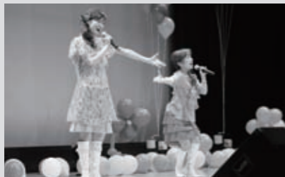
今年2月、福智町音楽祭を観客に感動を与えたDOYO組