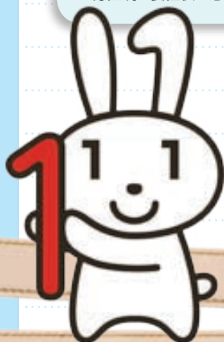
マイナンバーキャラクター マイナ ちゃん