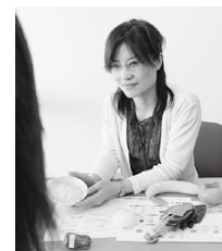
あなたの食事量の目安などを、保健師が直接分かりやすく説明。

健診から約1か月後に結果が出ます。その結果に基づき、保健師や管理栄養士から、一人ひとりに合った説明やアドバイスをしています。