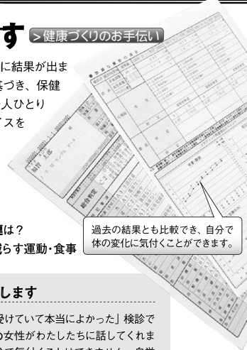
過去の結果とも比較でき、自分で体の変化に気付くことができます。