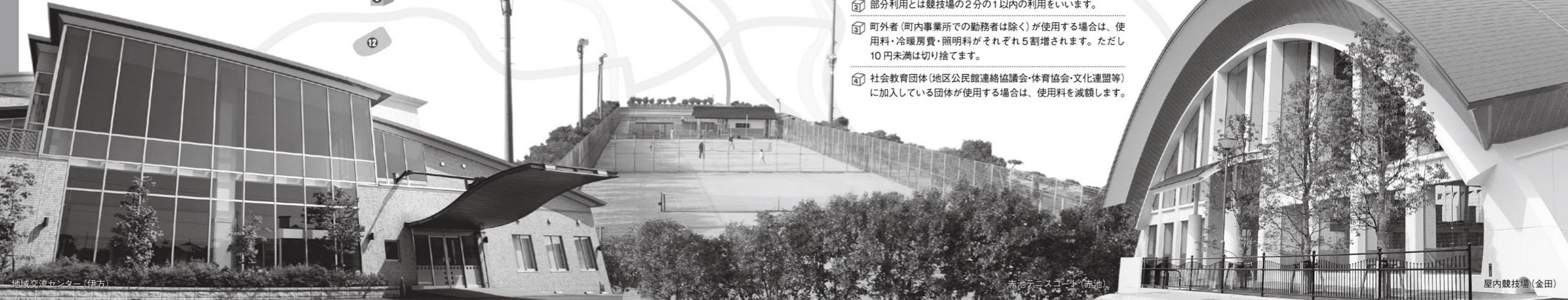
地域交流センター(伊方)