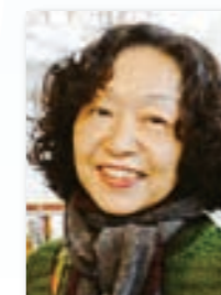
●コーディネーター 横山 眞佐子 さん

作家、エッセイストで日本福祉大学客員教授。著書に「アッチ・コッチ・ソッチの小さなおぼけ」シリーズ、「おどろぼうブラブラ氏」、「ハナさんのおきやくさま」、「ズボン船長さんの話」など。「魔女の宅急便」(福音館書店)で野間児童文芸賞、小学館文学賞、IBBY オナーリスト文学賞、路傍の石文学賞を受賞し、紫綬褒章や旭日小綬章を受章。代表作の「魔女の宅急便」は、平成元年にスタジオジブリによりアニメーション映画化、また平成 26 年には実写映画化され、広く国民に親しまれる作品として長く愛されている。