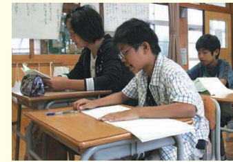
↑チャレンジタイム詩の暗唱。はっきりと大きな声で。

基礎的基本的な知識や技能を身につけるとともに、子どもたちが自ら主体的に学ぼうとする学習態度を身につけさせることをねらいとした「チャレンジタイム」を設定しています。 2学期は、詩の暗唱・計算チャレンジ・漢字チャレンジを行います。詩の暗唱は、単に暗唱するだけではなく、みんなに聞こえるように、はっきりと発音することもねらいとしています。計算チャレンジでは、それぞれの学年に応じた問題を、5分間で何問クリアできるか記録をとり、一人一人の子どもの伸びを見っていきます。漢字チャレンジでは、学期末の漢字のま