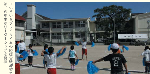
↑いきいきブレイクタイムの応援合戦練習で、6年生がリーダーシップを発揮。