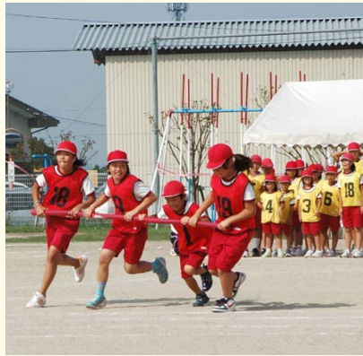
↑上級生が下級生をリードした「井城タイフーン」。

10月4日に開催された運動会。全校児童83人が、4つの班に分かれて日ごろの練習の成果を競い合いました。上級生から下級生までが、縦割り班活動で養ったチームワークで一致団結。より一層たくましくなった井城っ子の姿を披露しました。