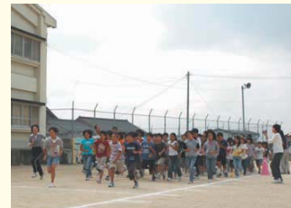
↑目指せ10分間走。パワーアップタイムの5分間走。

様々な運動を、継続的に実践することを通して体力の向上を図り、何事にもあきらめずに乗り越えようとする意識や態度を身につけさせることをねらいとして、10月から3つの時間を設定して活動します。