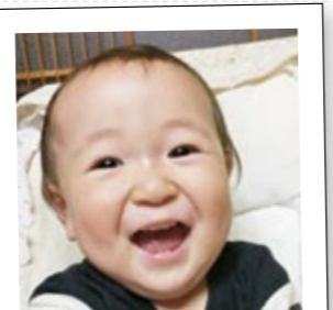
ひろわたり あゆむくん 1 廣渡 歩夢くん 1 H25.10.14 生 (赤池 高尾)