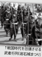
↑戦国時代を彷彿させる武者行列(岩石城まつり)