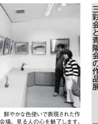
↑風景や人物など、鮮やかな色使いで表現された作品がズラリと並び会場。見る人の心を魅了します。

三彩会と青陽会の作品展 町文化連盟加盟の絵画グループ「三彩会」と「青陽会」による作品展が開催されます。ぜひご来場ください。 日時 4月18日(日)～4月23日(金)10時～17時(最終日は15時まで) 場所 上野の里ふれあい交流会館 ☎ 三彩会高須会長 ☎28-5483 青陽会平野会長 ☎28-2445