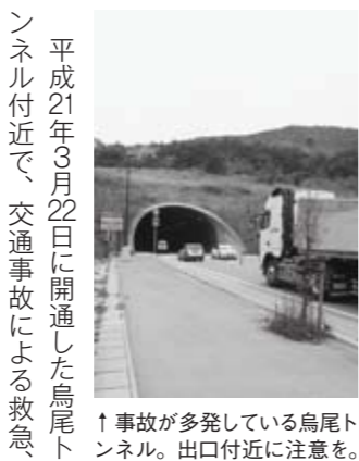
↑事故が多発している鳥尾トンネル。出口付近に注意を。

福岡県警察官募集 対象 昭和57年4月2日以降に生まれた人で、大卒(短期大学を除く)または平成25年3月までに卒業見込みの人 第一次試験日 5月13日(日) 申込書受付締切 4月23日(日) ※申込用紙は警察署や最寄りの交番に置いてあります。 ☎ 田川警察署総務課 ☎24-20110