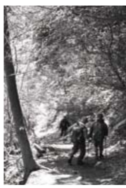
↑健康増進と、他町村との親ほくや交流を図ることが目的。

田川郡民登山会 日田彦山線の採銅所駅を起点にして、牛斬山(580m)に登ります。 日時 4月22日(日)9時30分集合 集合場所 香春町採銅所駅 申込締切 4月13日(日)※参加無料 ☎ 福岡県教育委員会 ☎22-22000