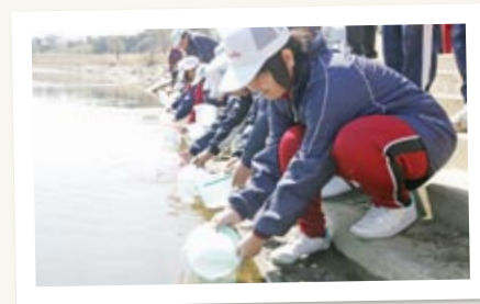
← ただ鮭の稚魚を放流するのではなく、遠賀川河川敷のごみを拾うことで、川の大切さや命の尊さを学びつつ、同時に社会マナーや環境保全の学習にもなります。

赤池中学校では、本校独自のカリキュラムとして、1年生の総合学習の時間を活用し、水に関する研究(水質調査など)を行っています。水質調査の仕方や遠賀川水辺館研修などを行い、その最後のまとめとして、彦山川に鮭の稚魚を放流する活動を行っています。これは、親子ふれあい行事とも兼ねていますので、保護者や地元のボランティアグループ「ひこさん川夢の会」と一緒に、川辺の清掃活動ののち、稚魚の放流を行います。鮭が成長して帰ってこられる美しい川なるようお願いを込め、今年度も3月のはじめに行う予定です。みなさんもぜひご参加ください。