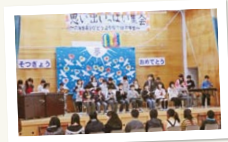
← ステージ下の6年生に感謝の気持ちを込めて演奏します。緊張しながらも、全員が6年生に感謝の気持ちを伝えるために、一生懸命な姿がとても印象的です。

もうすぐ卒業する6年生に、委員会活動やクラブ活動や登下校など、お世話になったことへの感謝の気持ちを伝える「6年生を送る会」があります! 毎年、各学年から「6年生へのお礼のこぼれ」歌・演奏劇などを披露します。どの児童も、どの学年もお世話になった6年生への感謝の気持ちを込め、精一杯に練習の成果を表現し合う素晴らしい会です。子どもたちの生き生きとした姿をぜひご参観ください。 日時 平成25年2月24日(日) 場所 上野小学校体育館