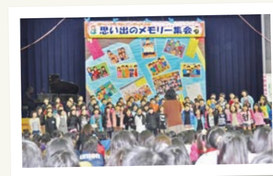
← みんなで短冊を飾り付けた後は、全学年がすばらしい歌や合奏を披露。最後は、6年生の発表で締めくくります。

3月1日に市場小学校で、「思い出のメモリー集会」を行います。今年も、保護者の皆さんはもちろんのこと、お世話になった方々も招待予定。そして、今まで集会活動など、中心となって企画・運営をしてきた6年生への感謝の気持ちを込めた集会にもなります。参加した全員の思い出に残る素晴らしい集会に、ぜひお越しください。 日時 平成25年3月1日(日) 場所 市場小学校体育館