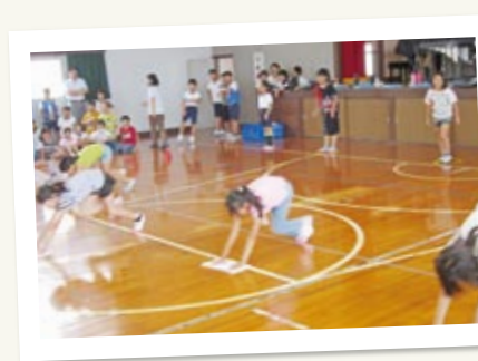
↑ 児童が自主的に企画運営した「雑巾がけ選手権大会」。子どもたちの応援に来てみませんか?

伊方小では、体力の向上を目指した取り組みの一環として、子どもたちの足腰を鍛えることを目的に、毎日の掃除時間だけでなく、体育の時間にも雑巾がけを行っています。「もっと雑巾がけを好きになってもらいたい。足腰をもっと鍛えてもらいたい」と、スポーツ委員会が「ぞうきんがけ選手権大会」を企画。第1回大会は一学期の終業式の日に行い、低学年(15m)と高学年(20m)の部に分かれて予選・決勝を行いました。現在も、毎日の掃除などにおいて子どもたちは雑巾がけを頑張っています。次回の「ぞうきんがけ選手権大会」は、来年2月に予定していますので、みなさんぜひお越しください。