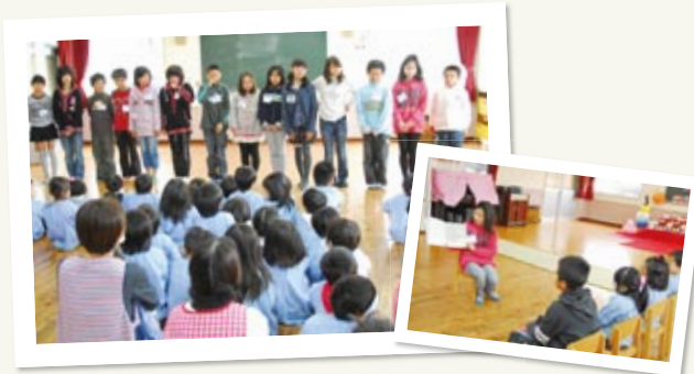
↑ どうすれば保育園の子どもたちが喜んでくれるか、事前に話し合いながら、体験する生徒全員で試行錯誤を重ねて準備します。

来年度の1月21日・22日の2日間、弁城小学校の5年生8人は、保育士体験を行います。体験する保育園は、学校の近くにある第一保育園です。体験する生徒は、0歳児〜5歳児までの各クラスに担当割りを決めて活動する予定です。事前に遊び方などを計画してその日を迎えます。保育園の子どもたちの目の高さになって関わることの大切さに気づくことと思います。この体験を通して、働くことの大変さや喜びについて考えるいい機会になればと思っています。