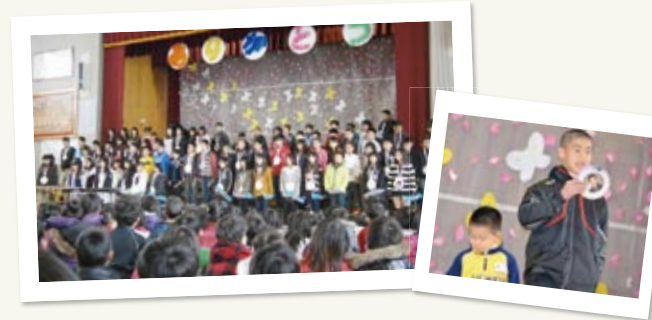
↑ 6年生への感謝の気持ちを込めた合奏や歌のプレゼント。胸にあるメダルは1年生が手作りしたメダル。感動の一日です。