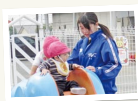
↑ 毎年さまざまな職場で仕事の厳しさややりがいを学びます。写真は中央保育所での体験の様子。

可愛い園児とともに一日を過ごす、3年生の保育実習が今年も行われました。実習を体験した生徒たちは、お兄ちゃんお姉ちゃんと呼びかけ、「とても楽しかった」「また行きたい」と、感動して帰ってきました。保育所・保育園の園児や先生にも毎年楽しみにされています。園児と一緒に遊んだりお話をしたりすることが、自分が役立っているという自己存在感を持ち、幼い子どもを理解して優しく接する気持ちや態度を養うことにつながります。今年度も、11月9日に、第一保育所・中央保育所・すずらん保育所・ぎんなん保育園の4カ所でお世話になりました。毎年ご協力ありがとうございます。