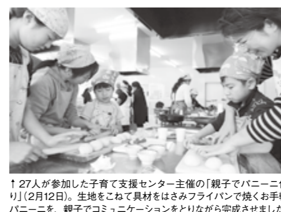
↑27人が参加した子育て支援センター主催の「親子でパニーニ作り」(2月12日)。生地をこねて具材をはさまみフライパンで焼くお手軽パニーニを、親子でコミュニケーションをとりながら完成させました。

心配ごと相談 4月15日(日)は司法書士による特別相談を実施します。特別相談は事前予約が必要。相談は無料です。 ① 日時 4月6日(日)10時～15時 場所 人権のまちづくり館 ② 日時 4月13日(日)10時～15時 場所 公民館方城分館 ③ 日時 4月15日(日)10時～15時 場所 金田社会福祉センター ④ 日時 5月11日(日)10時～15時 場所 公民館方城分館 問 社会福祉協議会 ☎22-6631