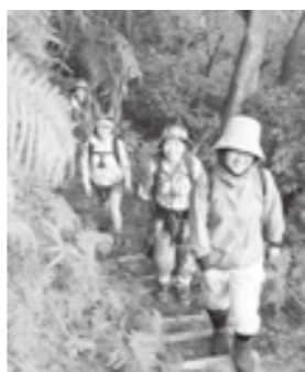
↑登山に適した服装でお越しください。昼食の弁当、水筒、雨具などの必要品は各自でご用意を。

第47回田川郡民登山会 田川の街並みや福智山の山容、周防灘など大パノラマが楽しめる「大坂山(573m)」山頂を目指します。 日時 4月23日(日)9時30分集合 集合場所 香春町呉タム溪流公園 申込期限 4月17日(日)(参加無料) 問 福智町教育委員会生涯学習課 社会体育係 ☎22-2200