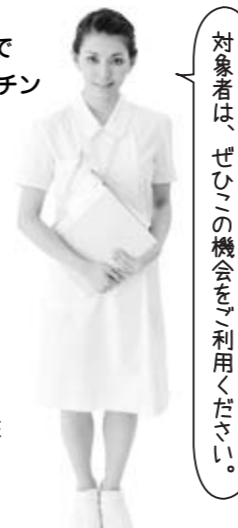
対象者は、ぜひこの機会をご利用ください。