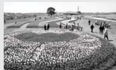
←世界各地のチューリップ32種類が華やかに咲き誇ります。