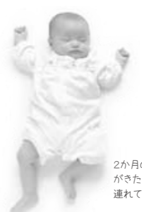
2か月のお誕生日がきたら、早めに連れていってね!

「予防するには？」 B型肝炎ワクチンで予防します。B型肝炎ワクチンは世界で初めての、がんを予防するワクチンです。ワクチンを接種することで、体の中にB型肝炎ウイルスへの抵抗力(免疫)ができます。母親が妊娠中に検査 肝炎が日本でも広がっており、知らない間にキャリアになった家族などから子どもへの感染も珍しくありません。以前は、B型肝炎にかかっても治癒したら「完治」と考えられていましたが、B型肝炎ウイルスの遺伝子は肝臓内に一生残ることが分かっています。免疫力が低下すると、重症の肝炎を発症するようになります。