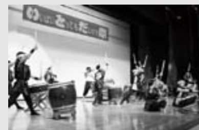
「歌や踊りの演芸発表のほか、糸田町民体育館では毎日でも陶芸などの各種展示があります。」

13日 日 10時～15時 (糸田町文化会館) 糸田の文化・芸術が満喫できる2日間です。 ☎ 糸田町役場教務課 ☎ 26-0038