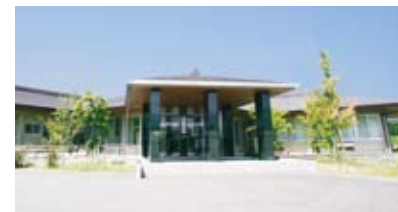
↑ 第1投票所「金田保健センター」

特に第1・5・6投票所は、前回の参議院議員選挙から変更していますのでご注意ください!