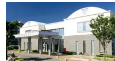
↑ 第5・6投票所「赤池支所」