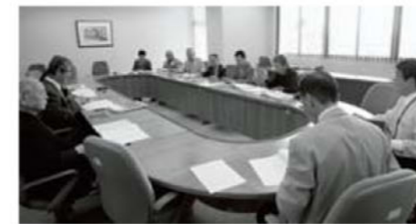
↑町内の民生委員・児童委員全員で構成される協議会。月に1回の定例会・役員会では、地域課題の分析などが行われ、社会福祉の増進を図る上で重要な場となっています。

「昔は地域や隣近所の付き合いが深く、困ったことは互いに助け合って解決していました。最近では普段から近所の連携が不十分なため、たとえ隣に支援を必要としている人がいてもそこに介入しにくく、困っている側も相談しにくいという課題があります」と、時代背景とともに変化した民生委員の役割を振り返ります。独居高齢者や自治会未加入の人が増えた分、できるだけ委員が地域に出向き、悩みを抱えた人がいないかなどの現状把握に努めています。