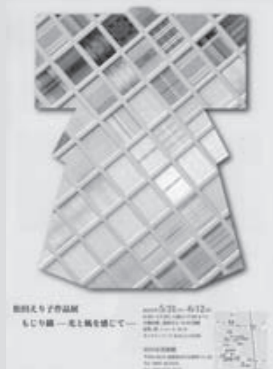
← グアテマラで織物に出会って40年。郷里田川で初個展をします。細やかに織り成された、清々しく高貴な作品をぜひご覧ください。