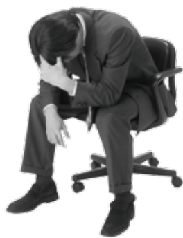
↑賃金未払いやパワハラなど、労働に関する問題の相談に応じます。