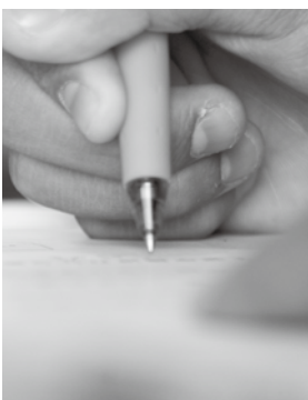
↑学習意欲があり、経済的な理由で就学が困難な学生を応援します。