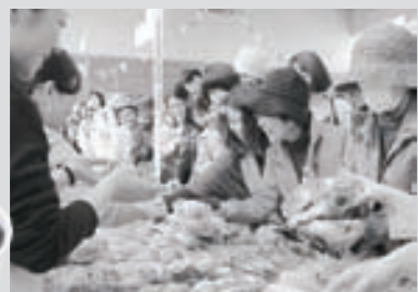
☎ 川崎町観光協会 ☎ 73-3838

【川崎町】かわさきパン博 2015 5月24日 日 10時～16時 (川崎町民会館・中央体育館) 県内外から約70店舗のパン屋さんやパンの「おとも」が集まります。ワークショップやトークイベント、スタンプラリーなど楽しいイベントが盛りだくさん。当日は町内観光スポットを巡るバスも運行予定です。一日ぐるっとおいしい時間をぜひ川崎町でお過ごしください。