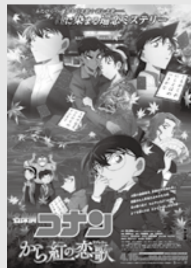
☎ 田川法人会 ☎45-8005

9月24日 回 13:30~15:30 (田川文化センター) ※入場無料ですが整理券が必要です。詳しくはお問い合わせください。