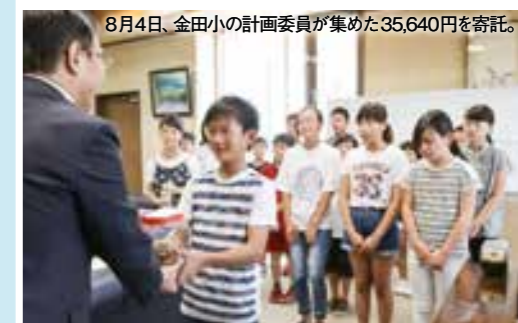
8月4日、金田小の計画委員が集めた35,640円を寄付。