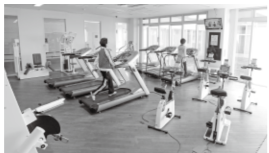
←10種以上の運動器具がそろったトレーニングルーム。ご利用の際は、運動用の室内シューズをご持参ください。

利用料金▶1時間あたり100円【利用対象は中学生以上】 利用時間▶ 月～金 は9時～21時 / 土・日 は9時～17時 休室日▶ 祝日 / 8月13～15日 / 年末年始 / 別途指定日 ※ 運動着、室内用運動靴、タオル、飲み物などは各自でご準備ください。 ※ 回数券(1時間券11枚:1,000円)がご得です。 ※ 治療中の人は、運動してよいかを必ず主治医に確認の上ご利用ください。