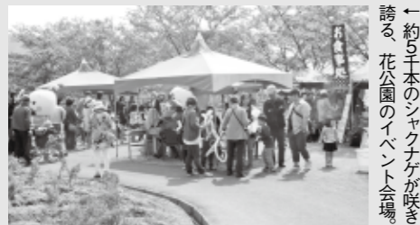
←約5千本のシャクナゲが咲き誇る、花公園のイベント会場

【添田町】シャクナゲまつり 4月18日(土)～30日(日) 9:00～16:30 (英彦山花公園) 期間中の土・日・祝日は、シャクナゲの見頃を迎える花公園内の特設テントで、特産品やしし汁などを販売するイベントを実施します。 入園料：高校生以上 200円 小中学生 100円