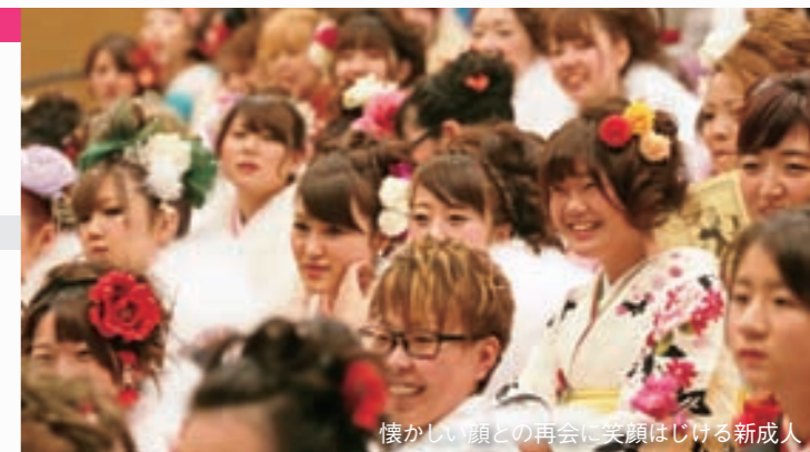
懐かしい顔との再会に笑顔はじける新成人