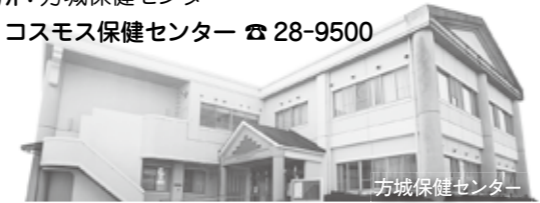
方城保健センター

※ 詳細は広報8月号に掲載していますので、ご覧ください。 電話での申込受付期間：10月3日金まで 日程：10月17日金・18日土・19日日・20日月 場所：方城保健センター ☎ コスモス保健センター ☎ 28-9500