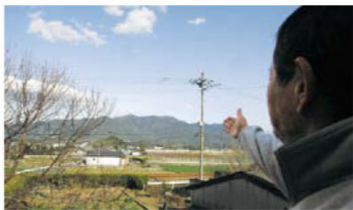
↑介春が晩年よく眺めていたという実家からの風景。時代が巡っても、山は変わらずわたしたちのことを見守っています。