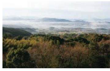
福智山のふもとから盆地を見下ろす絶好の眺め、自然の四季の移りも感じられる。夜景もキレイ。

福智山登山道の入り口に近い高所に建つ「白糸の湯」は、その見晴らしの良さと静けさが特徴です。露天風呂や家族風呂「レストラン白糸」からは、抜群の眺望を楽しむことができます。営業時間も午後11時までとゆったり。宿泊を利用すれば1泊2食付きで温泉にも好きなだけ入ることができます。上野焼の窯元めぐりや上野峡散策の後で一息つくのに最適な立地の「白糸の湯」。福智山登山の後の汗を流すかたも多いようです。