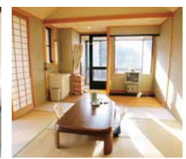
宿泊者のチェックインは15時、チェックアウトは10時。