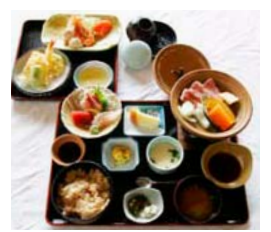
人気料理はあがの御膳 1700円。品数もボリュームも充分。