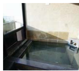
宿泊部屋のお風呂は半露天の作り、見晴らしも満喫できる。