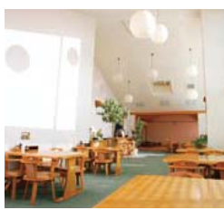
3階にあるレストラン白糸では、食事も景色も堪能できる。