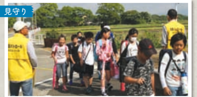
四区きずな会の下校時の見守り・誘導