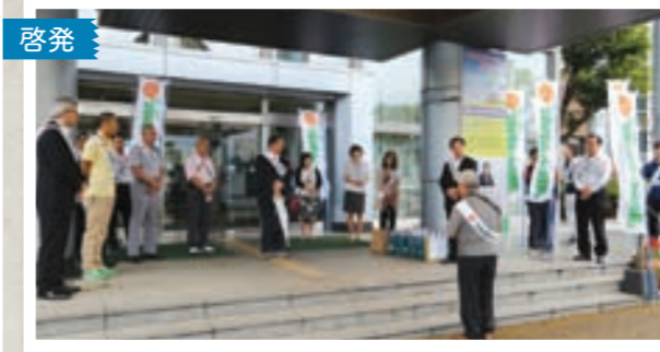
田川保護司会による社会を明るくする運動