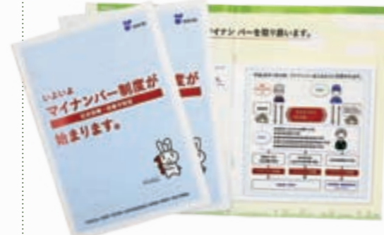
←配布する冊子では、個人・事業者それぞれの立場で、制度の導入に伴い変更する手続きなどを詳しく説明しています。

社会保障・税・災害対策などの分野で情報を効率的に管理するマイナンバー(社会保障・税番号)制度がいよいよ10月からスタートします。手続きや提出資料の簡略化はもちろん、不正受給などの防止や官民一体での情報管理など、よりきめ細やかな行政サービスを提供していきます。今月号に紹介冊子が折り込まれていますので、詳しくはそちらをご覧ください。