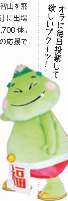
オラに毎日投票して欲しいブクーン!!

※スマートフォンをお持ちのかたは、各携帯会社提供の特設サイトからも投票できます(特典あり)。