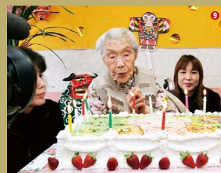
①平成16年の敬老会、園児たちの演技に笑顔がこぼれる。②112歳で日本最長者になる。17年4月5日、桜の下で会見。③同年秋、慶寿園の音楽療法で「ありがと、サンキュー」④17年10月、赤池町の名誉町民に。⑤広報紙の表紙撮影で。⑥114歳の誕生パーティー。