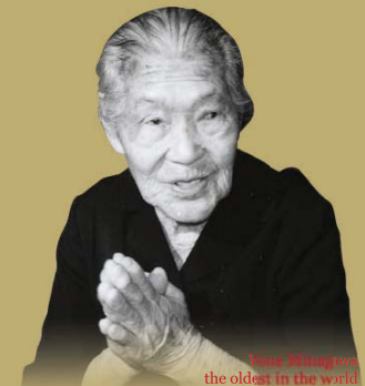
Yoko Kikawa the oldest in the world