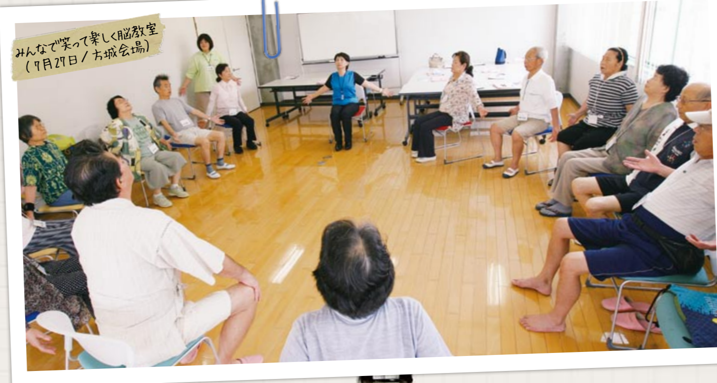
みんなで笑って楽しく脳教室 (7月27日/方城会場)

心 れあい交流に参加した時にこの教室を紹介され、介護予防をしてできる限り息子に迷惑をかけまいと思い参加しました。参加者の中では最高齢でしたが、計算やクイズなどの頭を使う問題も楽しくでき、参加して良かったと思います。