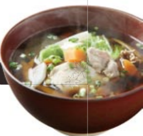
↑昨年、ご当地グルメ開発で復刻した「方城すいとん」。地鶏や旬の地元野菜で作られたふるりの一品です。現在「福智好いとん隊」が町外出展でPRしています。