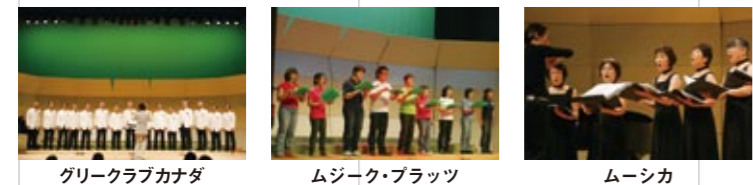
グリークラブカナダ

福智町文化連盟の音楽部会のみなさんによるステージです。「グリークラブカナダ」「ムジーク・ブラッツ」「ムーシカ」の3団体が美しいハーモニーを奏でます。(10:00~11:00)