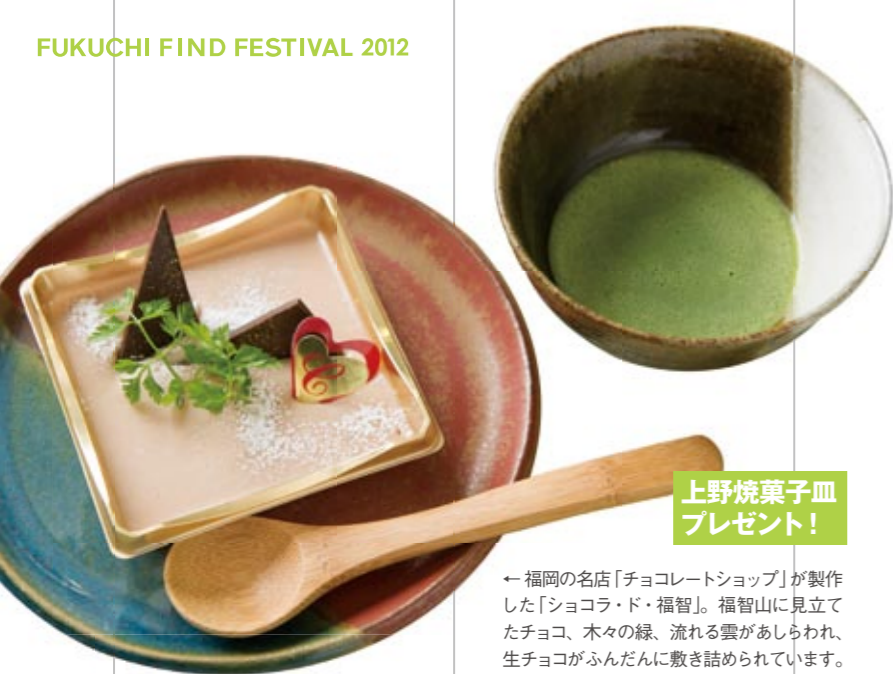
上野焼菓子皿 プレゼント!

←福岡の名店「チョコレートショップ」が製作した「ショコラ・ド・福智」。福智山に見立てたチョコ、木々の緑、流れる雲があしらわれ、生チョコがふんだんに敷き詰められています。