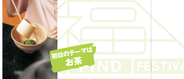
初日のテーマは お茶

←福岡の名店「チョコレートショップ」が製作した「ショコラ・ド・福智」。福智山に見立てたチョコ、木々の緑、流れる雲があしらわれ、生チョコがふんだんに敷き詰められています。