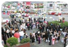
↑旧赤池町は夏の開催でした。