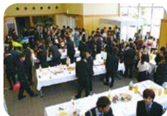
↑旧方城町も夏の開催でした。