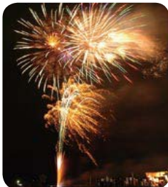
↑花火大会は3回の開催ではなく「1回で盛大に」という声も。

イベントのお知らせは「広報ふくち」で速やかにお伝えできるよう努力しますので、ご理解をお願いいたします。なお、来年度以降の計画については、本年度中に検討される予定です。