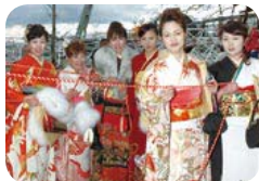
↑旧金田町は「成人の日」に開催。