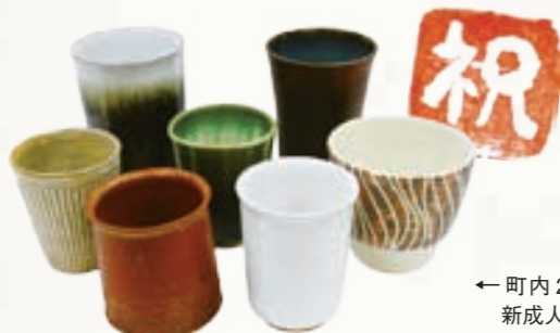
←町内26窯元制作のフリーカップが、新成人に記念品として贈呈されました。