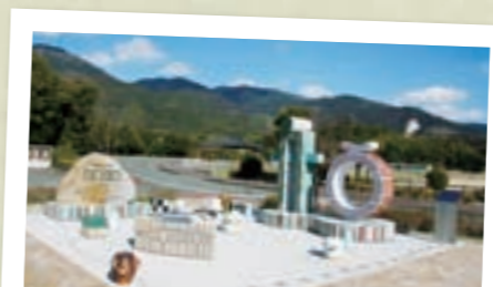
作曲家・河村光陽の 4