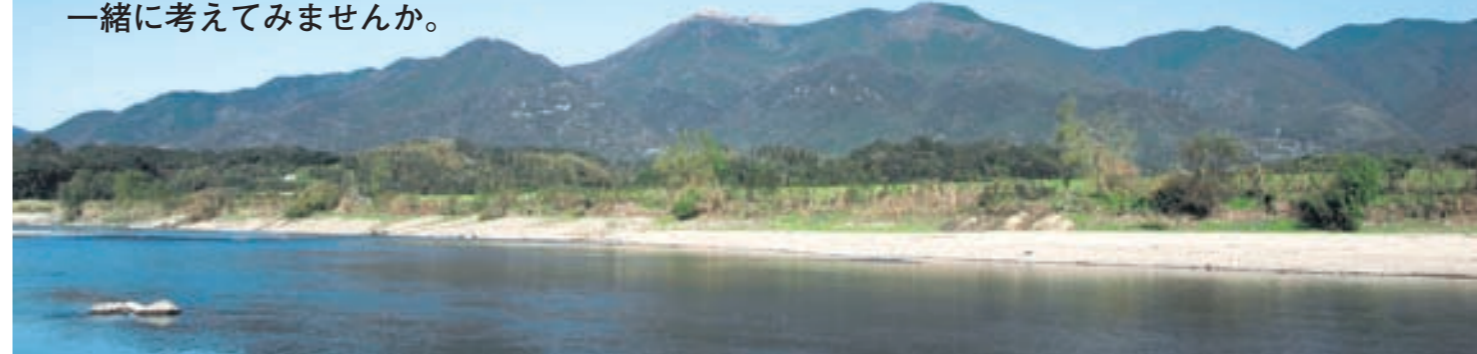
福智町のシンボル

魅力的なモノ・トコロがたくさんある福智町。 町の人は意外とそのことに気付いていないのではないのでしょうか。 外からの目で町を見つめ、新しい視点でコレカラを考える人たちに インタビューをしました。 「あたりまえ」の中にある町の魅力を 一緒に考えてみませんか。