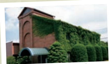
近代的遺産 10 記念館