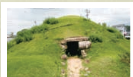
貴重な県指定史跡の 9