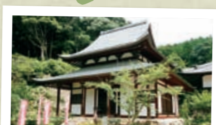
足利尊氏ゆかりの 8 仏殿