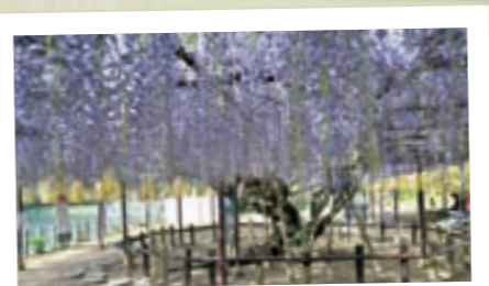
定禅寺が紫に染まる 5