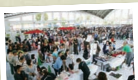
大人気「福智スイーツ」 6