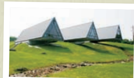
グッドデザイン賞の 11