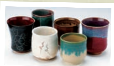
国指定伝統的工芸品 3