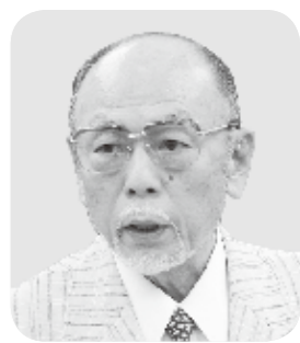
議員 公弘 属

【町長】 平成25年度をめどに行政機構の見直しを行っており、方向性などは定まっていますが、今後行政機構検討委員会のメンバーに伝えていきたいと思えます。