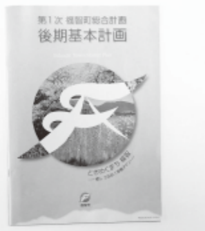
第一次福智町総合計画 後期基本計画

【まちづくり総合政策課長】 23年度は8803万7367円の赤字です。原因の一つは入浴