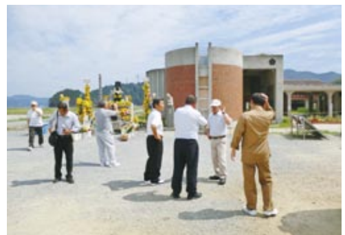
▲石巻市立大川小学校