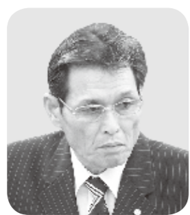
朝部 壽 議員