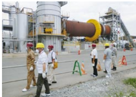
▲災害廃棄物処理施設（宮城県石巻ブロック）

視察した先々で目にした津波の傷跡は、私たちの想像を遥かに超え、復興には膨大な時間と資金が必要であり、福智町は東北から遠く離れていますが、被災地復興への協力を、改めて強く思った今回の研修でした。