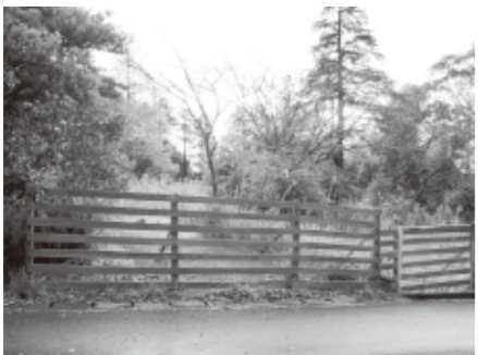
天郷青年の家の跡地