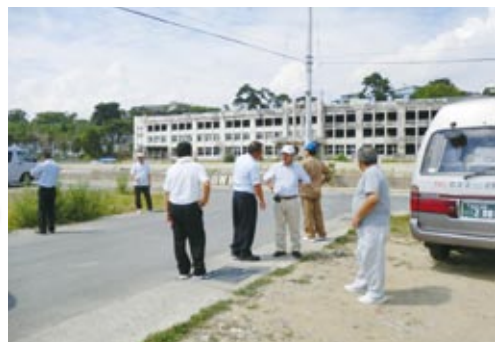
▲石巻市立門脇小学校

今年の7月11日から14日にかけて九州北部を襲った豪雨は、各地区に甚大な被害を与えました。私が住む神崎地区も県道が冠水し、家のすぐ入り口まで浸かりました。その日は、早朝より地元の消防団員と担当地区の見回りをしましたが、あっという間に近くの川が氾濫し、田畑や道路が浸かる状況となりました。これは私が思い出す限り、三十数年ぶりの出来事だと思います。