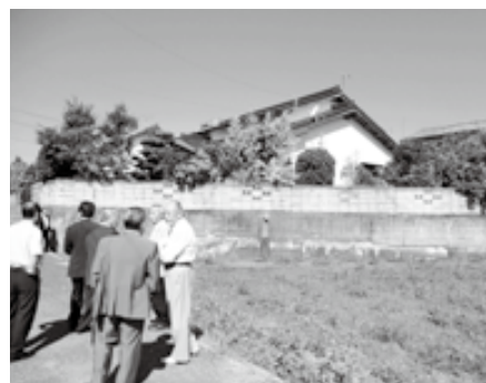
▲ ② 西金田堀川擁壁