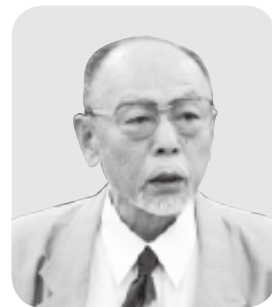
議員 公弘 属