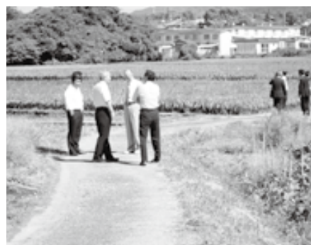
▲ ⑤ 上野堆肥舎付近農道