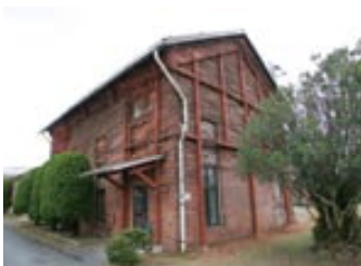
▲圧気室 壁には無数の電線の穴が空いている。