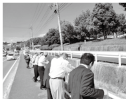
▲ ④ 県道小竹線水路(冠水箇所)