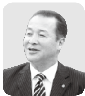
日比生 洋一 議員

答 各診療所は長い間地域に根付き、住民の命と安全を守る大事な機能を果たしています。医師を確保し、赤字が出ないよう努力し、診療所を存続させたいと思ひます。