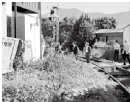
▲ ③ 東金田横田踏み切り