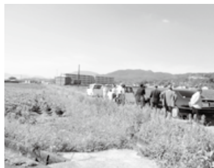
▲ ① 金見鉄道跡地