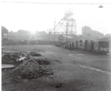
▲三菱方城炭鉱。 右側建物が赤煉瓦記念館。

外壁は三菱鋁業所が製作した高品質の赤レンガが使用されています。方城炭鉱の閉山後、煙突や堅坑槽は解体されましたが、『坑務工作室』『圧気室』『坑内風呂』『機械工作室』は、現在も残っており、当時の貴重な資料となっています。