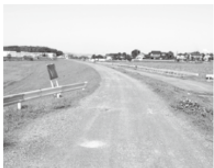
▲ ⑥ 上野輝ヶ瀬道路