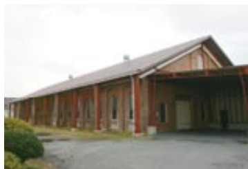
▲坑内風呂 当時は、中で職員用と坑内員用に仕切られていた。