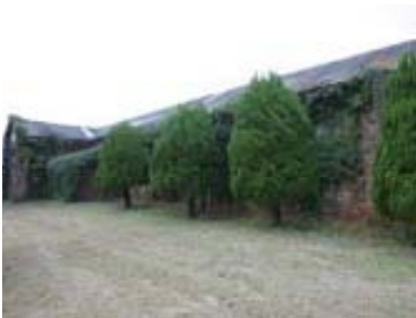
▲機械工作室 赤煉瓦記念館の並びにある建物。